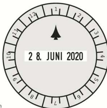
2910/U1-12 - Ø 50 mm

> Uhrzeit einstellen durch einfaches Drehen des Einstellrings