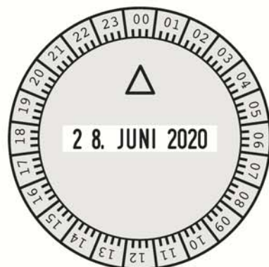
2910/U1-24 - Ø 50 mm